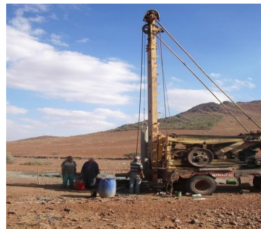
Travaux d'approfondissement du puit du Douar

Lors de notre déplacement sur site afin d'évaluer l'avancement du projet « Amélioration de l'accès à l'eau de boisson » arrêté au 31 Août 2018, nous avons constaté au niveau des foyers et des différentes enceintes du Douar l'achèvement des travaux suivants :