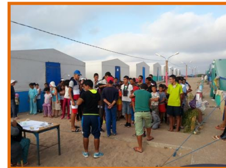
Enfants du Douar en pleine activité culturelle