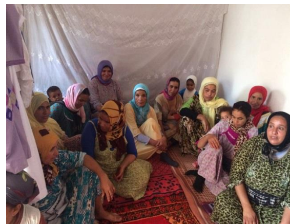
Assemblée Constitutive de la coopérative artisanale ayant pris place au siège de la coopérative

Lors de notre déplacement sur site afin d'évaluer l'avancement du projet « Constitution d'une coopérative artisanale pour les femmes » arrêté au 31 Août 2018, nous avons constaté au niveau du Douar l'achèvement des actions suivantes :