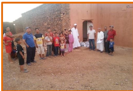
Opération de distribution des trousseaux de toilettes aux enfants