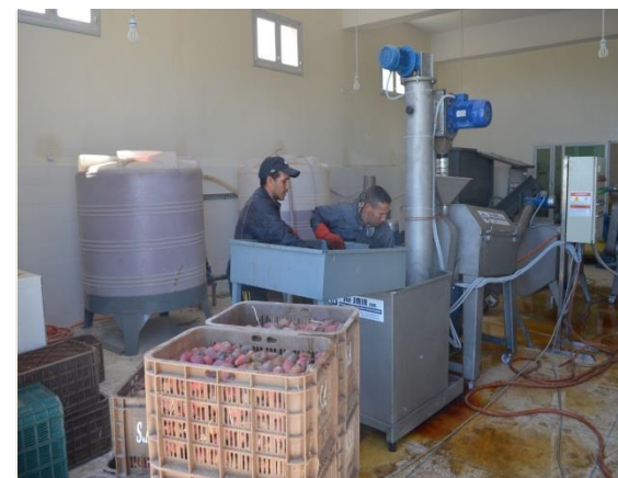
Opération de pressage du fruit de Cactus au niveau de l'unité de valorisation

Lors de notre déplacement sur site afin d'évaluer l'avancement du projet « Création d'une coopérative de valorisation du cactus » arrêté au 31 Août 2018, nous avons constaté au niveau de l'unité de production et l'achèvement des actions suivantes :