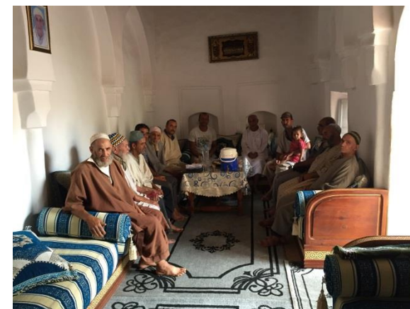
Assemblée constitutive de la coopérative d'élevage ayant eu lieu au siège de la coopérative

Lors de notre déplacement sur site afin d'évaluer l'avancement du projet « Création d'une coopérative d'élevage ovin et caprin » arrêté au 31 Août 2018, nous avons constaté au niveau du Douar l'achèvement des actions suivantes :