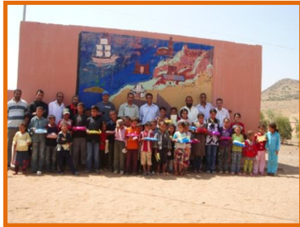
Distribution du prix de mérite en fin d'année scolaire

Rappel du bilan de A2D: Période allant de 2010 à 2014