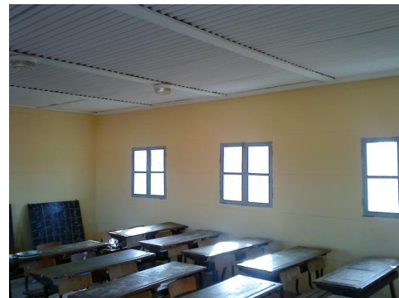
Peinture des murs internes de la 1 ière Classe

Lors de notre déplacement sur site afin d'évaluer l'avancement du projet « Appui à la scolarisation des enfants (dont préscolaire) » arrêté au 31 Août 2018, nous avons constaté au niveau de l'école du Douar l'achèvement des travaux suivants :