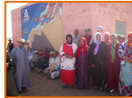
Photos du stand-up « Against poverty »