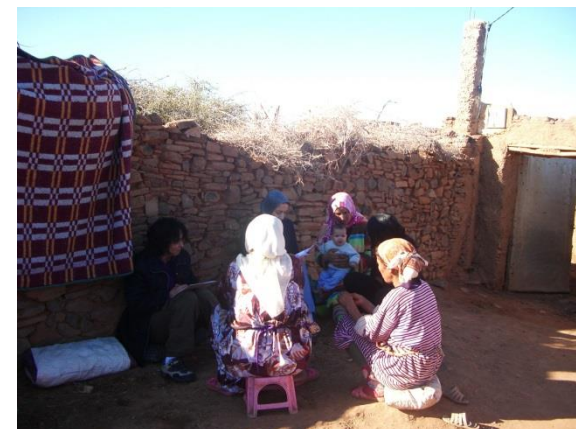
Séance d'évaluation du besoin de formation des femmes cibles du projet

Lors de notre déplacement sur site afin d'évaluer l'avancement du projet « Construction d'un centre de formation pour femmes » arrêté au 31 Août 2018, nous avons constaté au niveau du Douar l'achèvement des actions suivantes :